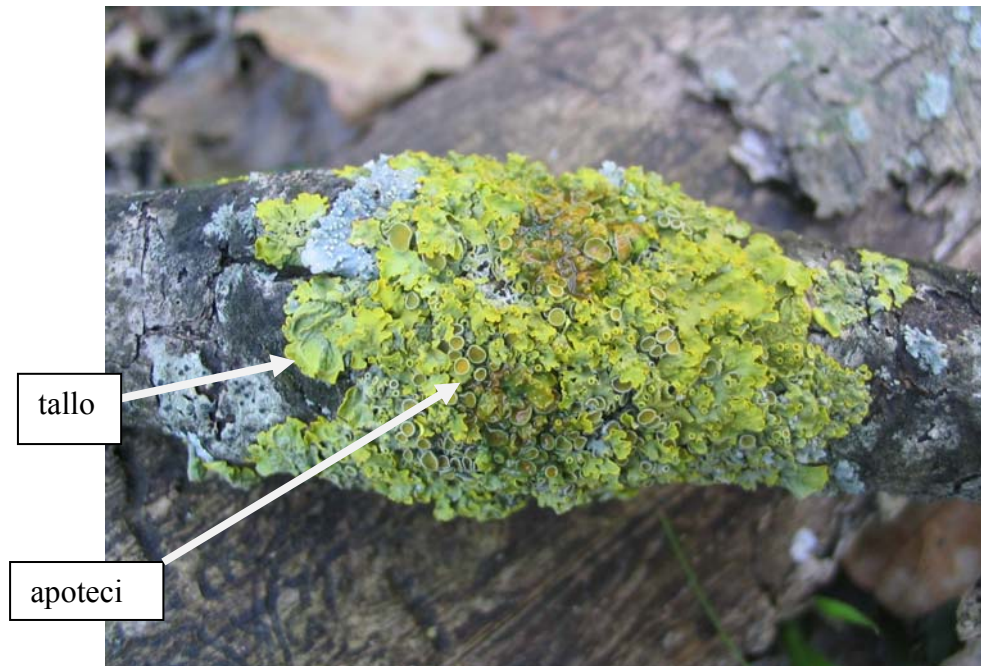
Fig. 1. Lichene Xanthoria parietina .

Nella struttura del lichene in Fig.1 , s'individua una parte foliosa ( tallo ) ad accrescimento vegetativo ed un elevato numero di strutture rotondeggianti ( apoteci ) contenenti le spore (riproduzione sessuata) per la diffusione della specie. La colorazione giallo-verde è dovuta all'alga simbiote Trebouxia.